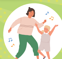
親子リズムダンス