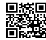
渋谷区スポーツセンター 公式X