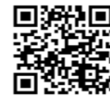
渋谷区スポーツセンター ホームページ